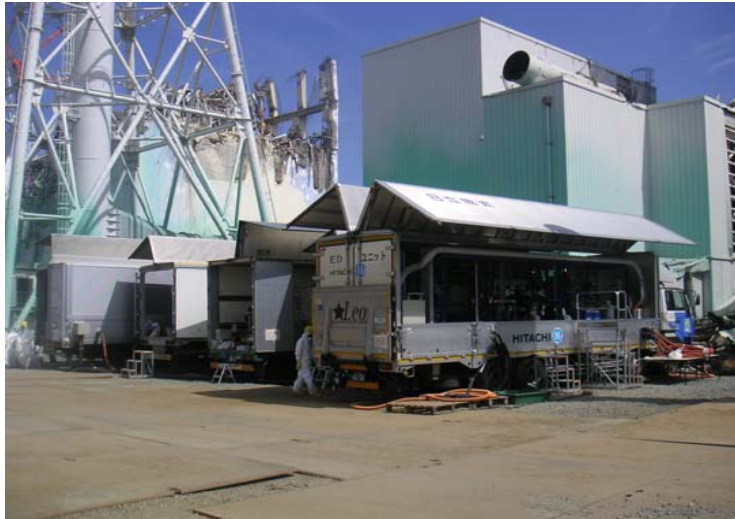
＜塩分除去装置全体＞