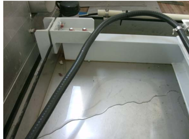
＜漏えい状況（拭取り実施前）＞