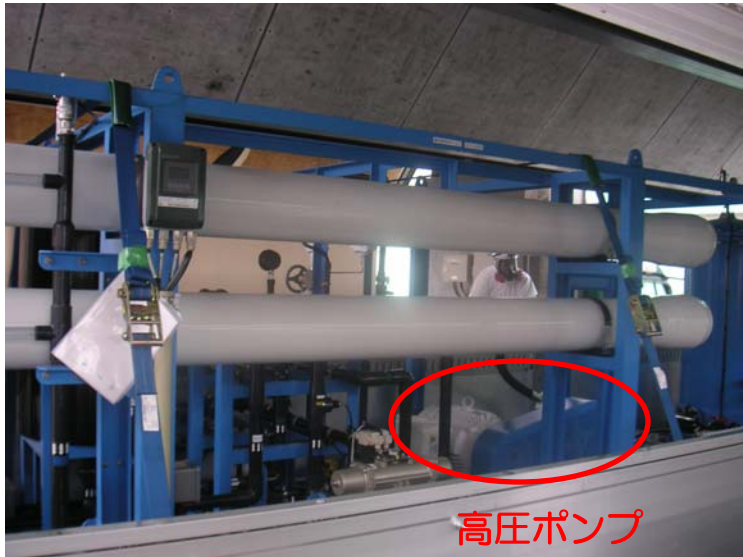
＜逆浸透膜ユニット逆浸透膜＞