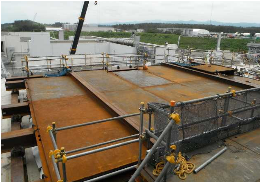
使用済燃料プール防護構台設置状況

今後は、オペフロ上にある大型機器（原子炉格納容器・原子炉圧力容器の蓋）等の撤去を7月下旬～10月に実施すると共に、燃料取り出し用カバーの設置工事を進めて参ります。