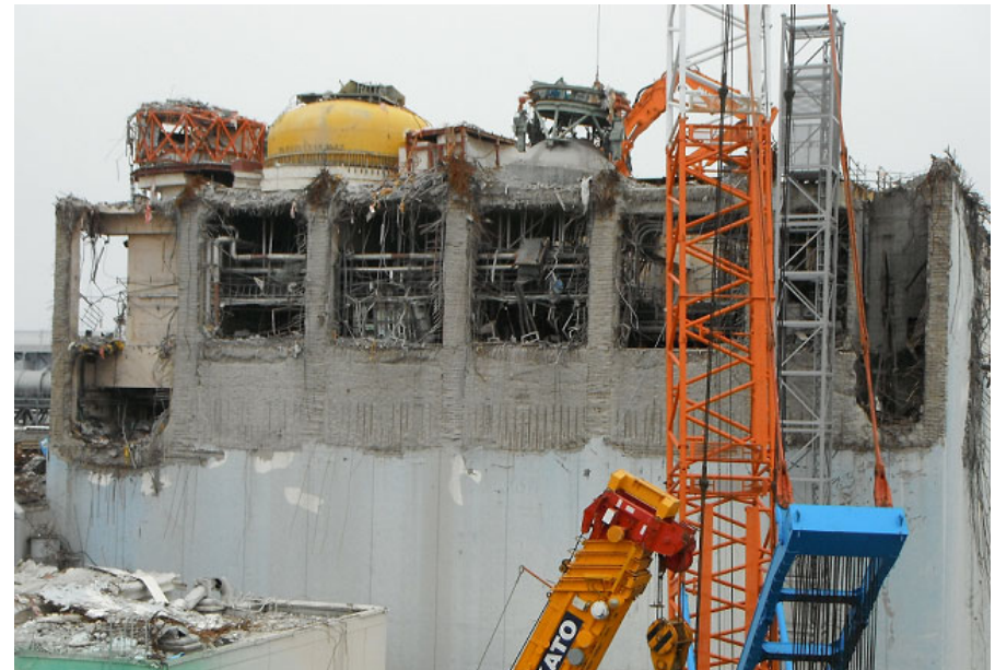
建屋瓦礫 撤去工事 完了後 [オペフロ上部:西面]